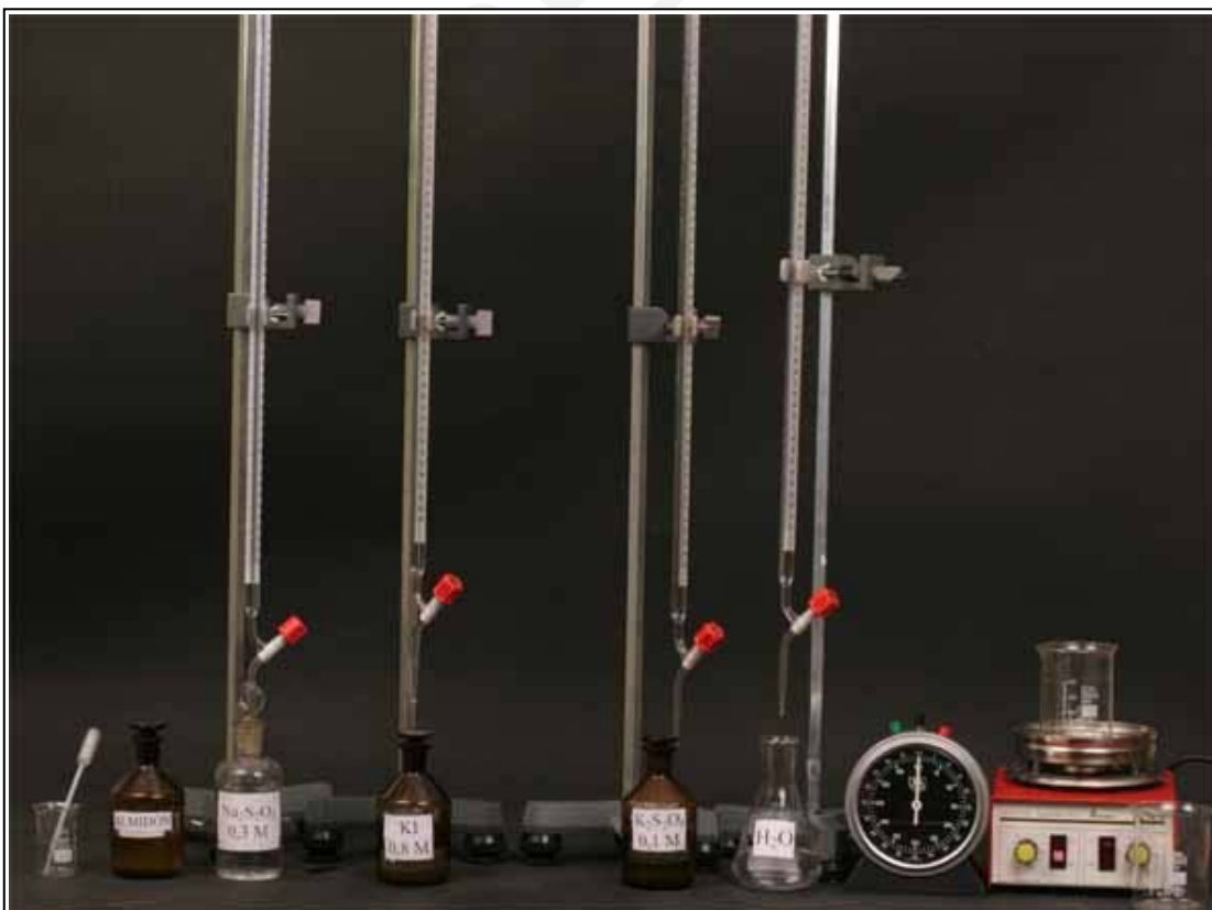
Foto del montaje

En la foto del montaje se ha utilizado peroxodisulfato potásico 0,1M