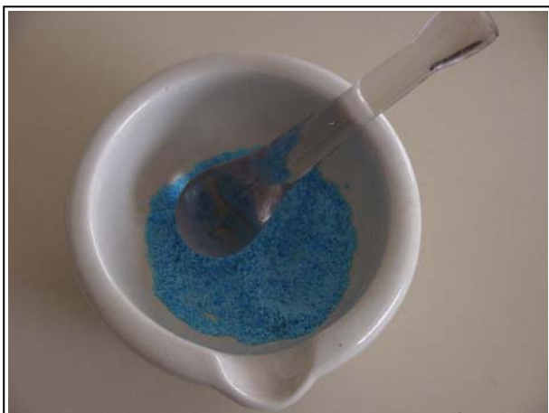
Fotografía del montaje

El sulfato de cobre hidratado tiene color azul y el deshidratado blanco grisáceo, este cambio de color es el que permite seguir el proceso de deshidratación mediante observación visual